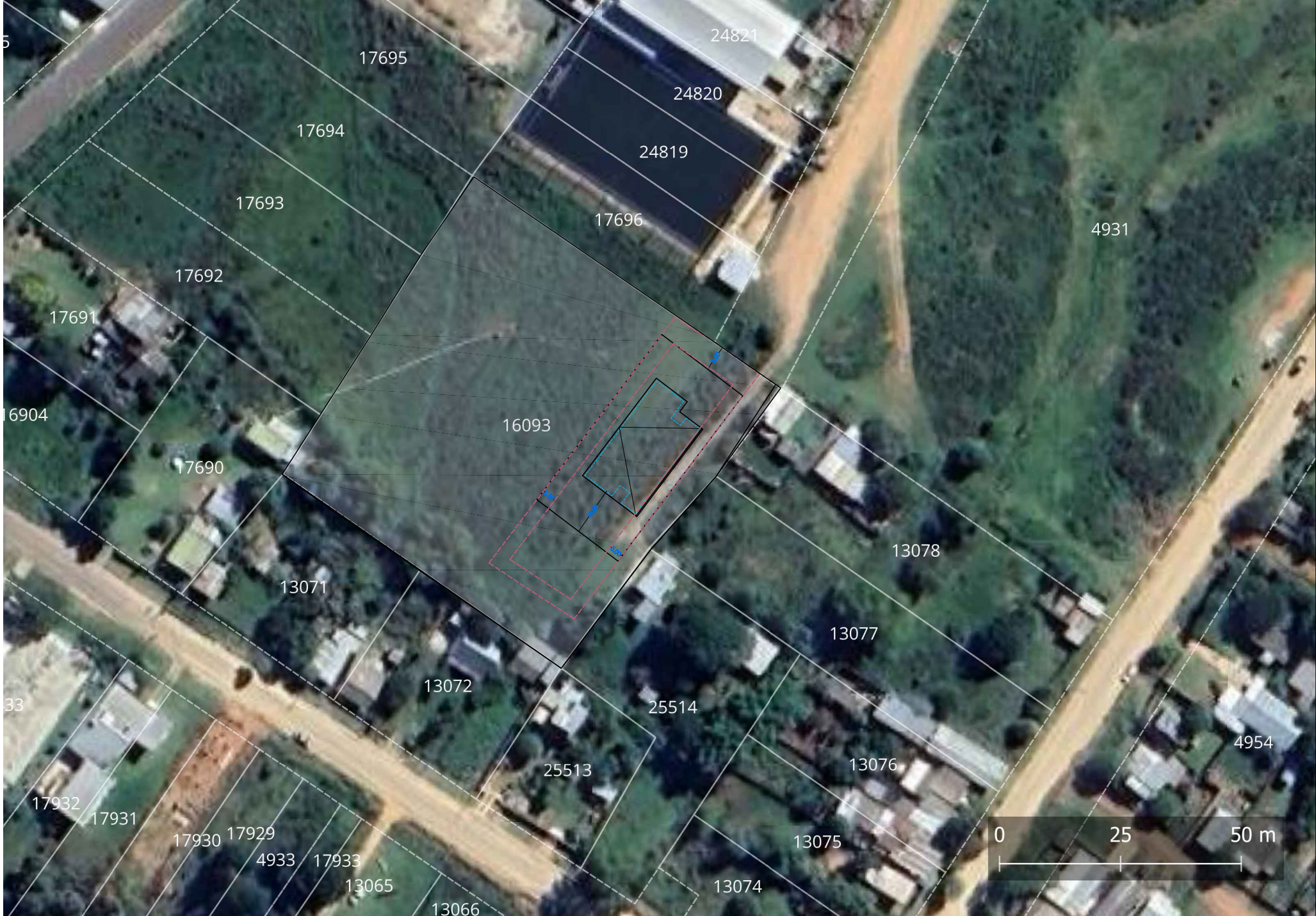
PLANTA UBICACIÓN esc. 1:1000